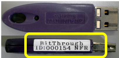
製品名 : BitThrough 製品 ID : **00154

製品 ID はアルファベット 2 文字+右詰め 5 ケタです。アルファベットの無い場合は空白になります。以下に参考例を示します。(空白部分は*で表示しています)