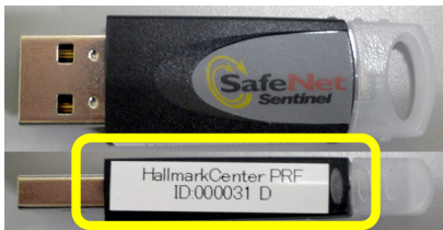
製品名 : HallmarkCenter PRF D 製品 ID : **00031